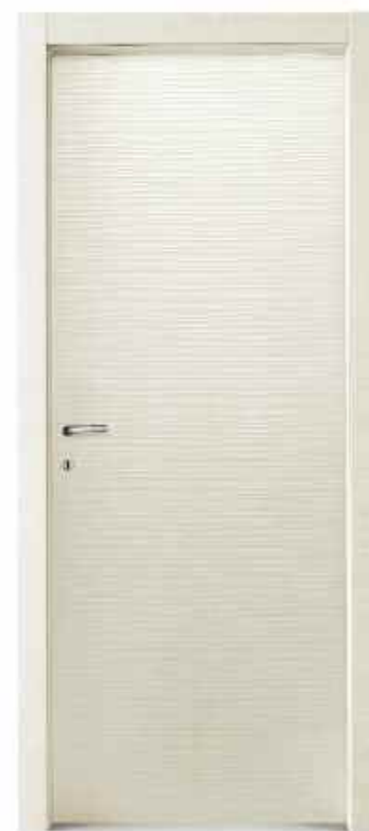
LINO ONDA Flax wave - Льяной волнистый - Lin vague