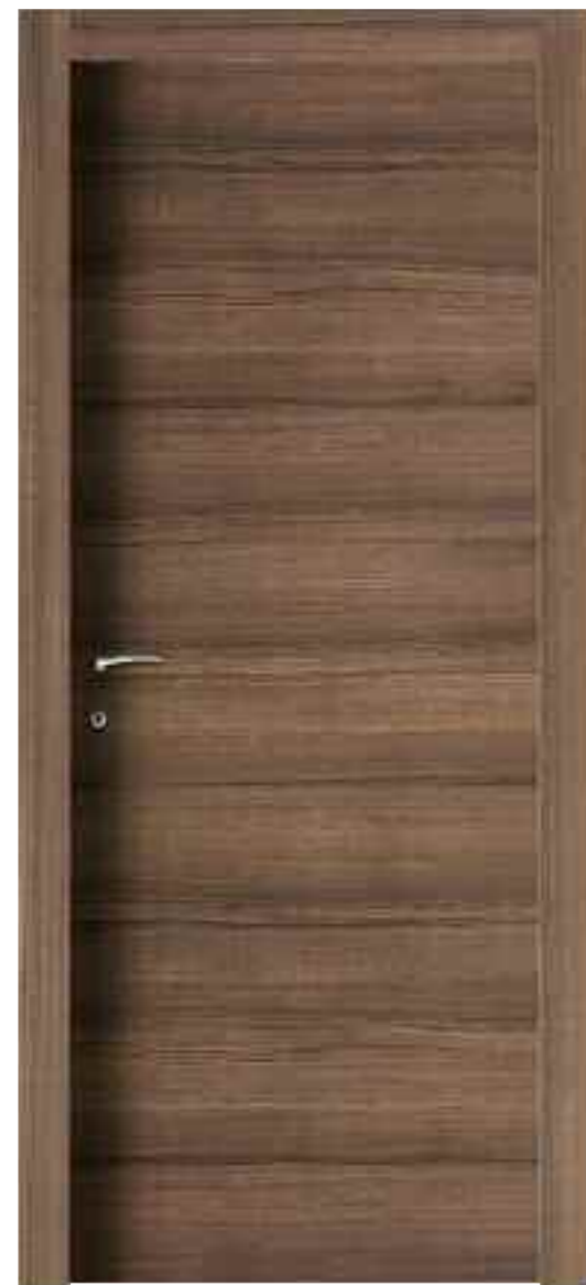
Noce Canaletto Canaletto Walnut - Орех Каналетто - Nagal Canaletto

Sur les quatre finitions bois ou le charme des essences se joint avec les exceptionnels prestations qualitatives du revêtement Door, pour mieux mettre le bloc port sur chaque ambiance