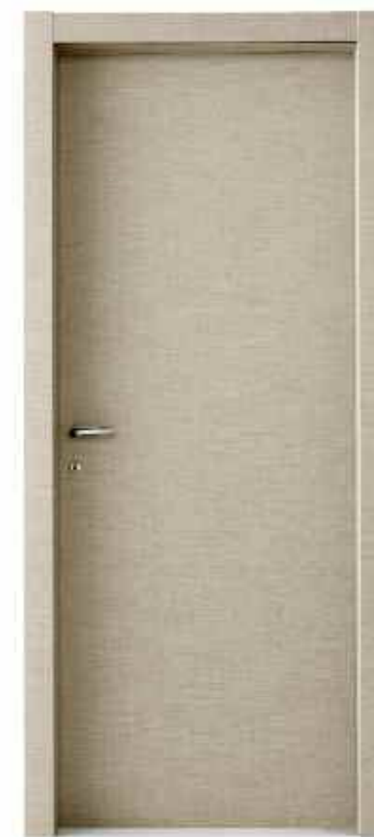
CANAPA Hemp - Льняной волнистый - Chanvre