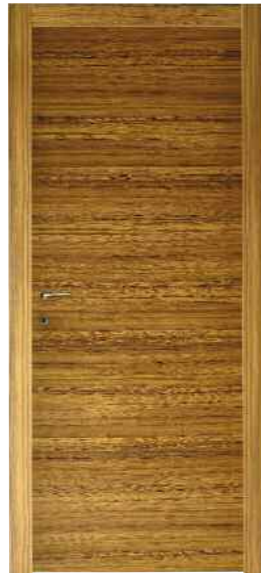
Teak Teak - Тик - Тек