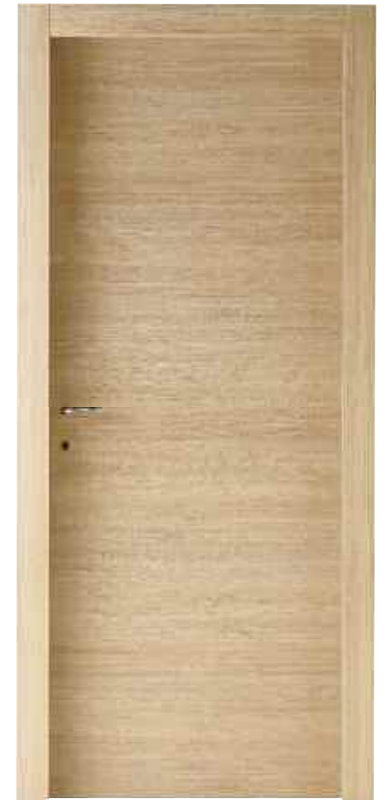
Rovere Chiaro Light Oak - Светлый дуб - Chêne Clair