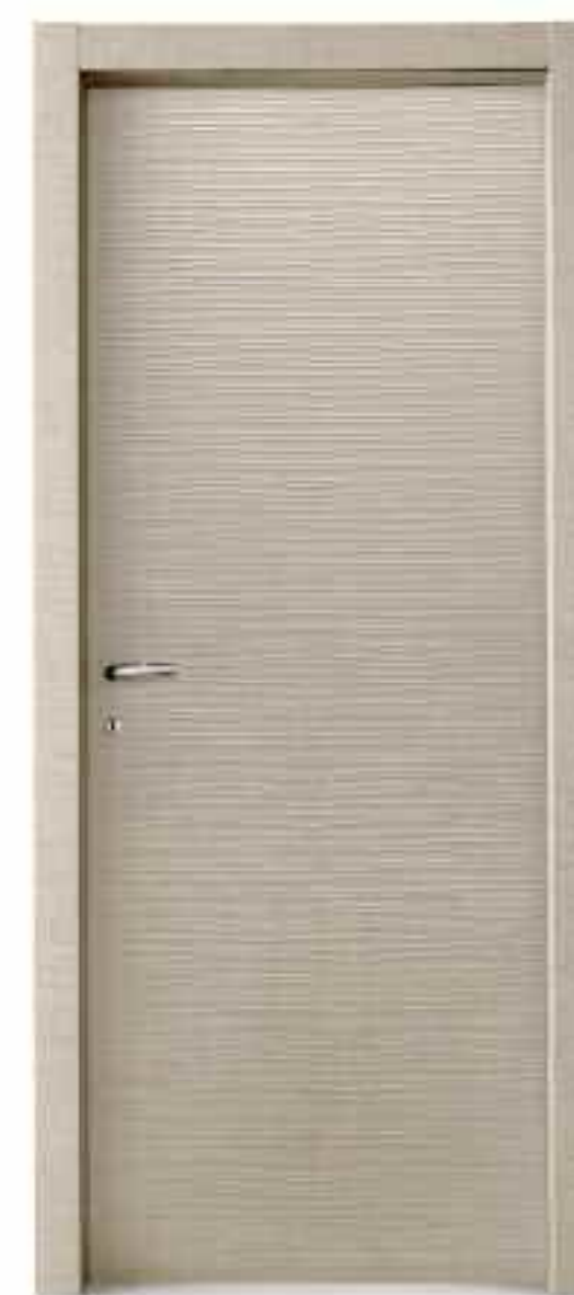
CANAPA ONDA Hemp wave - Льяной волнистый - Chanvre vague