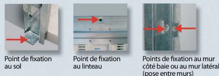
Point de fixation au sol Point de fixation au linteau Points de fixation au mur côté baie ou au mur latéral (pose entre murs)

La porte DWM® se fixe directement au sol et aux murs, en 7 points uniquement, sans équerres*, grâce à son huisserie qui intègre les trous de fixation.