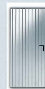
Onde de 100 mm

Son vantail monobloc à nervures verticales, est en acier galvanisé prépeint RAL 9016. L'huisserie tubulaire est en acier galvanisé. Elle comporte un verrouillage 1 point et est livrée avec quincaillerie complète (béquille nylon, plaque de propreté et cylindre).