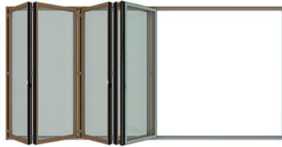
Vouwing van de verbonden elementen Pliage des panneaux articulés