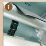
Verrous automatiques (anti-soulèvement)