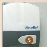
Bouton poussoir intégré au bloc de commande