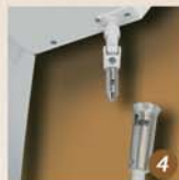
Manœuvre manuelle possible avec la manivelle de secours (dérochable) fournie