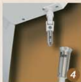
Manœuvre manuelle possible avec la manivelle de secours (dérochable) fournie