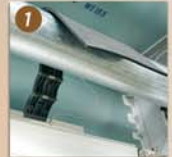
Verrous automatiques (anti-soulèvement)