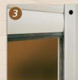
Barre palpouse (détection d'obstacles)