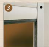
Barre palpouse (détection d'obstacles)