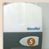
Bouton poussoir intégré au bloc de commande